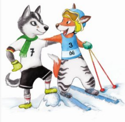
Illustration: Sabine Straub