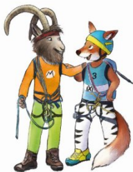
Illustration: Sabine Straub