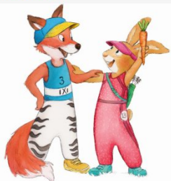
Illustration: Sabine Straub